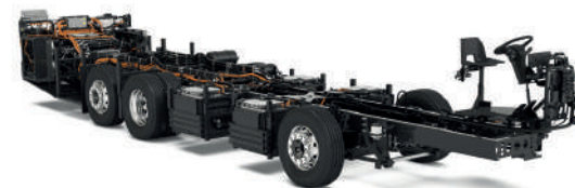
Volvo BZR eléctrico