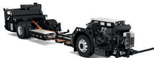
Volvo BZL eléctrico

En Volvo trabajamos para que el transporte público urbano e interurbano sea limpio, silencioso y eficiente. Nuestros modelos Volvo BZR eléctrico y Volvo BZL eléctrico , equipados con una tecnología puntera en electromovilidad son la solución perfecta. Con nuestros autobuses, servicios eléctricos y Volvo como socio, las ciudades pueden dar el paso a las cero emisiones, cero ruido, cero congestión y cero accidentes.