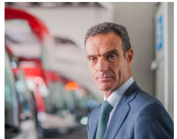
Rafael Barbadillo, presidente de Confibus

La digitalización no solo permite optimizar la gestión de flotas, sino que facilita la información en tiempo real para los pasajeros y la eficiencia en la operación de las rutas. Además, Barbadillo recalca la importancia de la